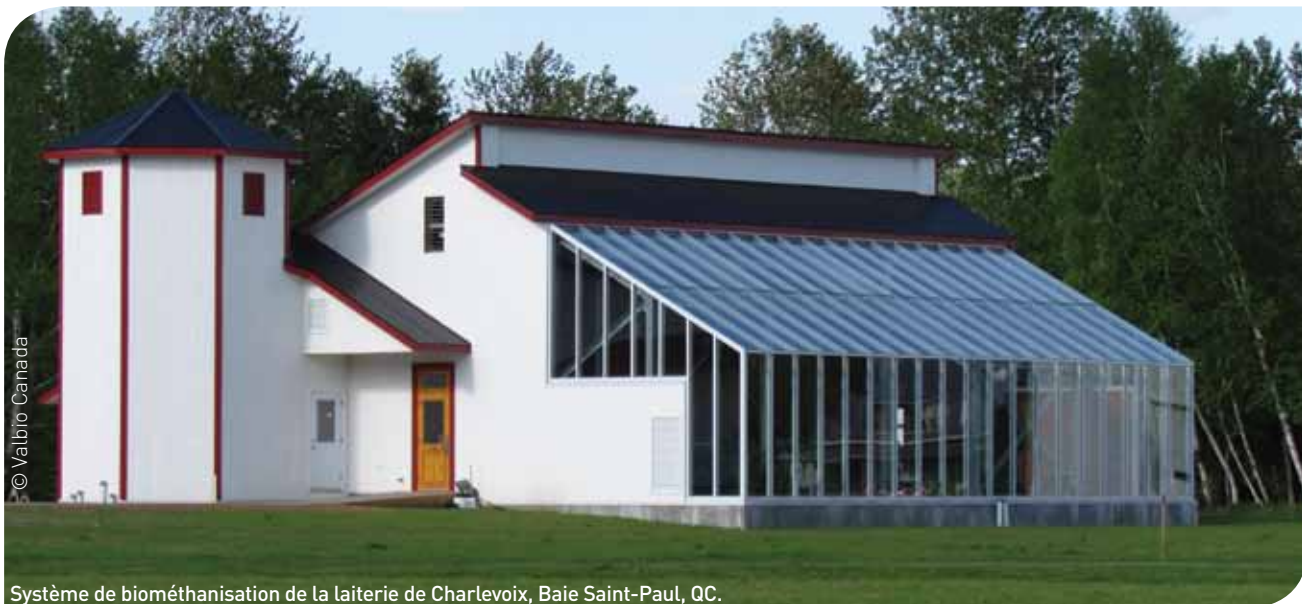
Système de biométhanisation de la laiterie de Charlevoix, Baie Saint-Paul, QC.