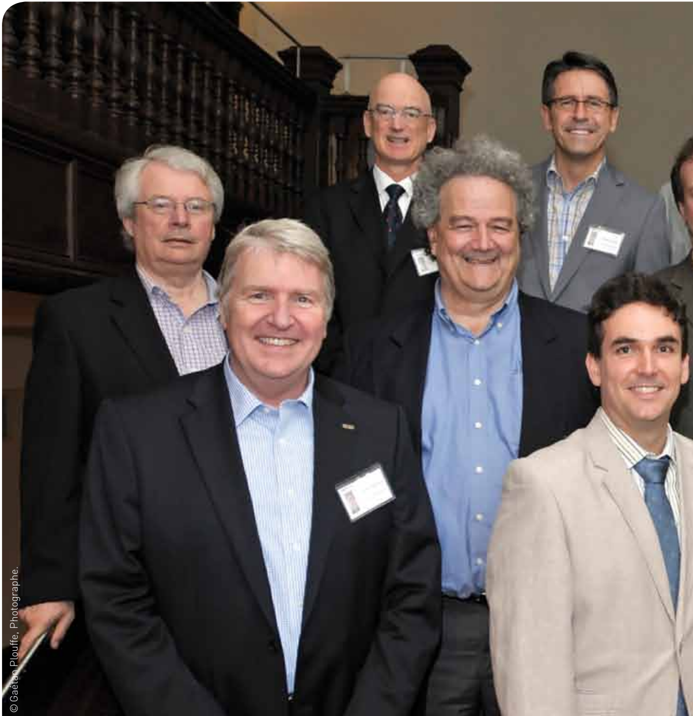
LE CONSEIL D'ADMINISTRATION 2011-2012 DE L'AQPER: (DE GAUCHE À DROITE)